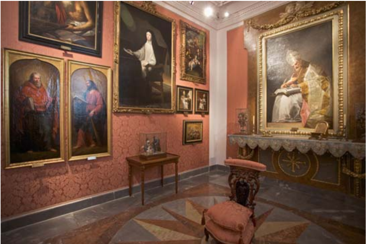
El Oratorio (Sala XIII) Museo del Romanticismo

La oración, ese movimiento del corazón que lo lleva a Dios y lo une a él, es una experiencia incommunicable e inaprensible para el historiador del arte, no obstante, el Oratorio del Museo del Romanticismo, como lugar creado originalmente para este fin, es una muestra de espacio privado para la oración propio de las casas señoriales. La decoración con pintura religiosa de los siglos XVII y XVIII que acompaña a nuestro cuadro de San Isidro Labrador y Santa María de la Cabeza, es una práctica muy habitual durante el Romanticismo, momento en el que tuvieron también enorme éxito las copias de pinturas religiosa del pasado, teniendo gran aceptación la tradición murillesca.