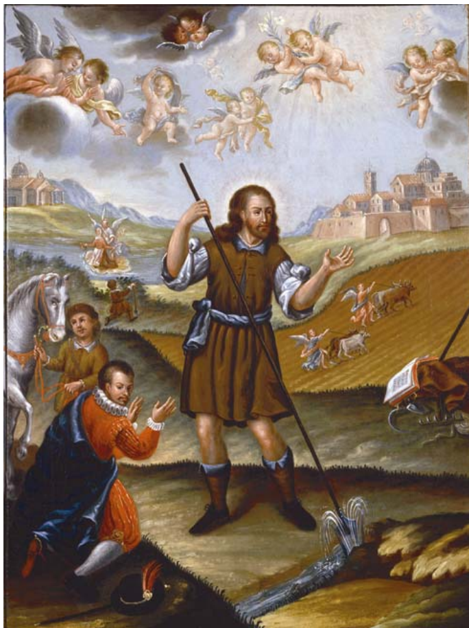
José Conchillos San Isidro y el milagro de la fuente Óleo sobre lienzo, 1771 Museo de los Orígenes

(más conocido como Códice de Juan Diácono), de finales del siglo XIII. Según este texto, San Isidro nació en la Villa de Madrid entre 1080 y 1082, momento en que no había sido aún reconquistada. De padres mozárabes 9 , antes de ser labrador se dedicó a trabajar como pocero.