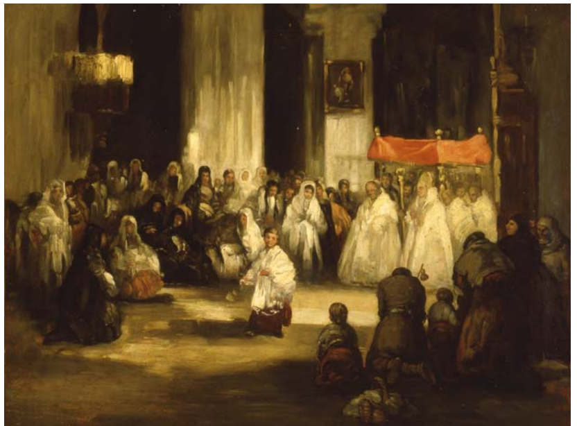
El Dios Grande Leonardo Alenza y Nieto Óleo sobre lienzo, 1840-1845 Museo del Romanticismo. Inv. CE0813 Sala XII (Anteoratorio)

Este Dios Grande es otra de las muestras de devoción arraigada en el pueblo, de la que nos habla Modesto Lafuente, oculto tras el seudónimo de Fray Gerundio, en su Teatro Social del siglo XIX . Según cuenta el autor, pasada la Pascua de resurrección, y terminado el plazo que la iglesia señala a los fieles para cumplir con el precepto de “comulgar por pascua florida”, cada parroquia administraba el cuarto sacramento a sus respectivos feligreses enfermos e imposibilitados, en su propia casa, lo cual hacía con gran pompa y solemnidad, destinando al efecto un día festivo, y llevando el sagrado Viático en procesión por las calles. Desde la víspera se anunciaba por una comisión de campanillas, pífanos y tambores, que recorrían las calles de la capital (se hacía igualmente en otros muchos pueblos de España). Las familias que vivían en la carrera ofrecían a los amigos y conocidos los balcones de sus casas, los cuales el día que salía el Dios Grande de la parroquia se adornaban con las mejores colgaduras y se colmaban de devotos espectadores.